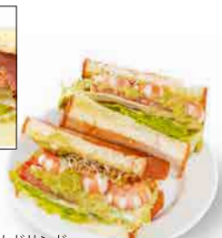
エビとアボカドサンド

18 パストラミサンド [1296] 燻製した塩漬けビーフの薄切りをたっぷり挟み栄養価の高いアルファルファとチーズ、レタスを合わせました。バランスの取れた一品です。