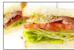
パストラミサンド