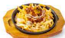
チリチーズポテト

26 フライドポテト [454] 当店のハンバーガーととても相性の良い、細くてカリッとしたポテトです。