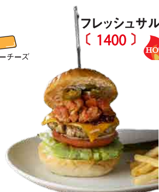
フレッシュサルサバーガー 〔 1400 〕