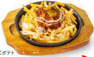
チリチーズポテト