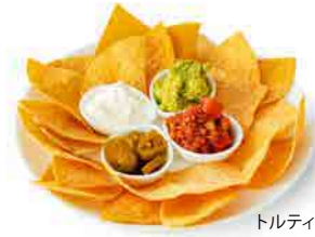
トルティーヤチップス

当店自慢のポテトの上に自家製チリビーンズを乗せ、チーズをたっぷりかけて焼き上げました。ボリューム満点のあつあつをどうぞ。