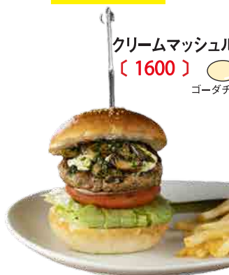
クリームマッシュルームバーガー 〔 1600 〕

プリプリのエビとまったりとしたアボカドディップを、たっぷりと乗せました。サラダ感覚でいただけるヘルシーなハンバーガーです。