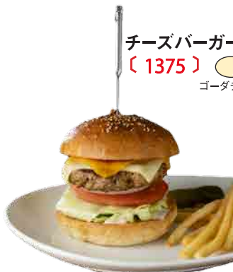
チーズバーガー 〔 1375 〕

エアーズバーガーカフェのハンバーガーはメキシコ料理を7年間修業したシェフが厳選したパティ(オーストラリア産ショートグレイン(良質な穀物飼育)の牛肉と黒毛和牛を使用。安全でおいしいビーフ100%のパティを使用しています。)とパンズ(パティとの相性を考え、改良を重ねて焼き上げたオリジナルのパンを使用。保存料・添加物を一切使わない体に優しいパンズです。)を使い、ご注文をいただいてから一つ一つ丁寧に調理しています。豪快な見た目の中にひそむ繊細な味と食感をお楽しみください。