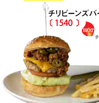
チリビーンズバーガー 〔 1540 〕