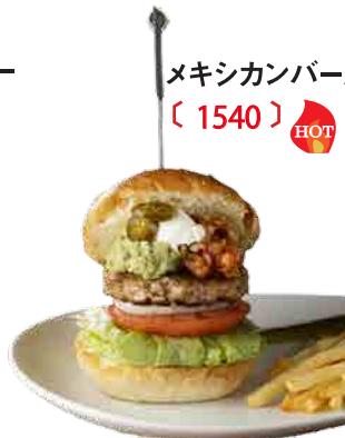
メキシカンバーガー 〔 1540 〕

ソテーしたブラウンマッシュルームとチーズが溶け込んだホワイトソース。濃厚な旨味をお楽しみください。