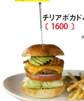
チリアボカドバーガー 〔 1600 〕