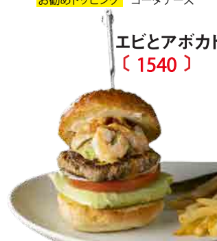
エビとアボカドバーガー 〔 1540 〕

プリプリのエビとまったりとしたアボカドディップを、たっぷりと乗せました。サラダ感覚でいただけるヘルシーなハンバーガーです。