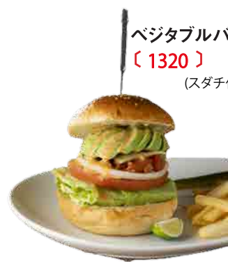
ベジタブルバーガー 〔 1320 〕

サルサソース+アボカドディップ+サワークリーム。「まったりとしていて、それでいてしつこくない」おいしさです。