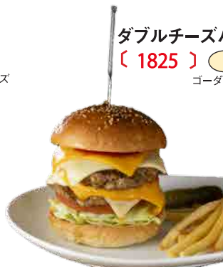
ダブルチーズバーガー 〔 1825 〕